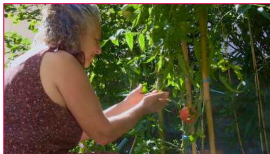
© Nazzaréna Matera et Christophe-Emmanuel Del Debbio

Comment s'émanciper dans un monde devenu insupportable ? Comment échapper à un système aliénant ? La quête d'une réponse nous fait ici voyager dans l'espace et le temps. Au fil des rencontres, on présuppose que l'autonomie c'est d'abord choisir ses dépendances et faire valoir sa légitimité par rapport à la légalité. Mais l'autonomie, ce n'est pas l'autarcie. Au final, elle est reliée aux interdépendances avec les humains et le vivant.